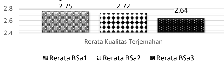
Gambar 2. Rerata Kualitas Terjemahan BSa1, BSa2 dan BSa3

Gambar 2 berikut ini adalah sebaran nilai rerata baik itu TSa1, TSa2 maupun TSa3. Model penilaian kualitas dalam penelitian ini menggunakan model penilaian kualitas terjemahan yang dicetuskan oleh Nababan, Nuraeni, dan Sumardiono (2012). Berdasarkan model penilaian tersebut, nilai 1 pada terjemahan tersebut mengindikasikan bahwa terjemahannya tidak akurat, tidak berterima dan memiliki tingkat keterbacaan rendah. Nilai 2 menandakan bahwa terjemahan tersebut kurang akurat, kurang berterima, dan memiliki tingkat keterbacaan sedang. Sedangkan, nilai 3 berarti terjemahan tersebut, akurat, berterima dan memiliki tingkat keterbacaan yang tinggi. Rerata terjemahan ketiga nove tersebut digambarkan dalam Gambar 2 berikut ini.